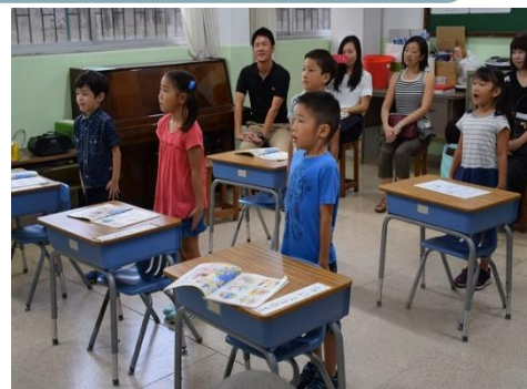
第一回授業参観日(土曜参観)