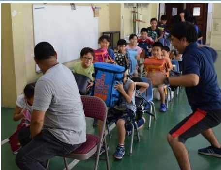
避難訓練(バス乗車時)