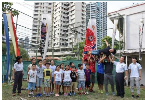
季節集会(鯉のぼり集会)