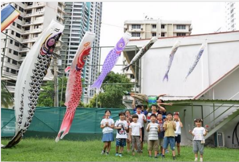
季節集会(鯉のぼり集会)