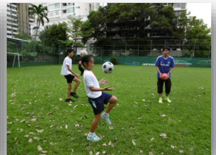
放課後活動(小学部3年以上)